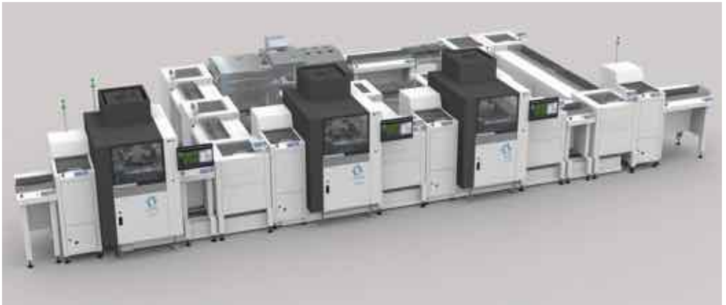
Exentis-3D-Produktionseinheit für das industrialisierte AM-Verfahren

Kleinserien, bietet die 3D-Siebdrucktechnologie bei der Herstellung komplexer Strukturen und grosser Stückzahlen grosse Vorteile. Im 3D-Siebdruck lassen sich geschlossene Kanäle frei in die 3D-Struktur integrieren und Strukturabmessungen ab 60 µm realisieren. Dabei werden feine Schichten aufeinander gedruckt. Vor jedem nächsten Schichtauftrag wird ein Trocknungsschritt zwischengeschaltet. Durch automatisierte Siebwechsel lassen sich komplexe geometrische Strukturen erzeugen. Die auf diese Weise erzeugten metallischen oder keramischen Teile werden danach gesintert.